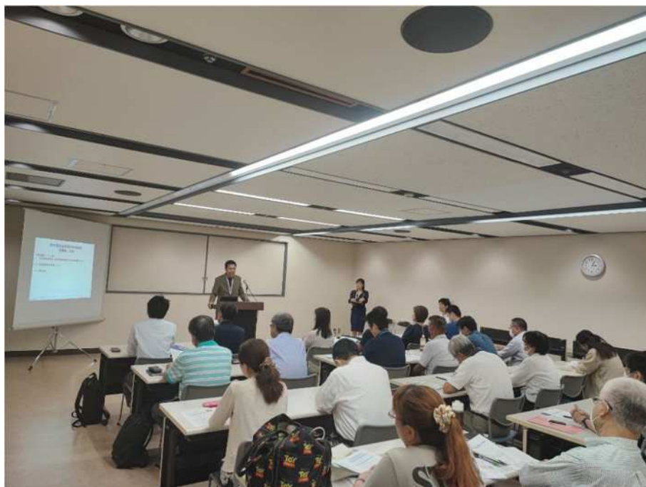
説明会 新百合ヶ丘会場