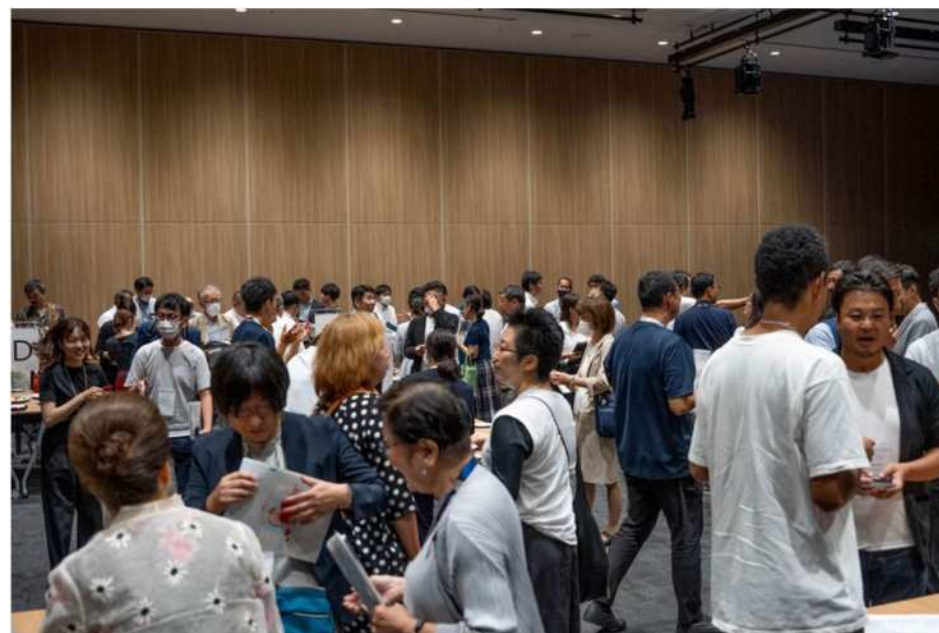
交流会 武蔵小杉会場