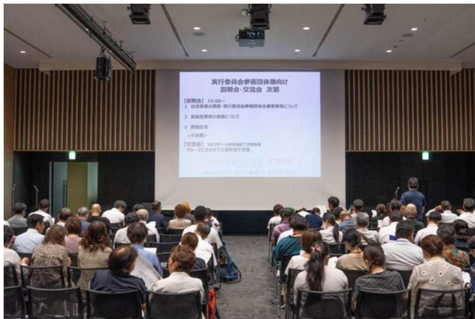
説明会 武蔵小杉会場