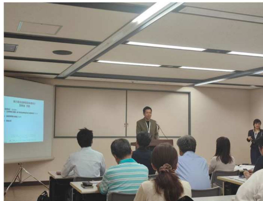
説明会 新百合ヶ丘会場